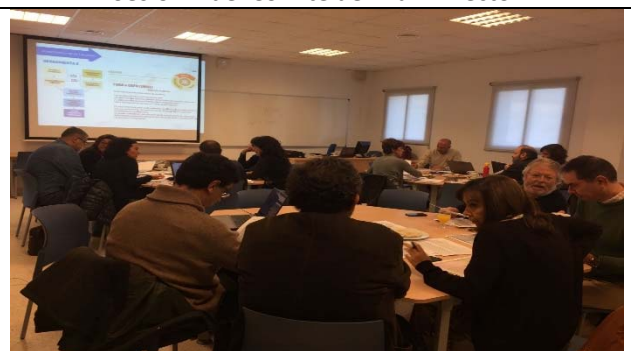
Sesión 3 del Comité del Plan Director