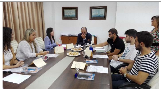
Grupo Focal de Estudiantes