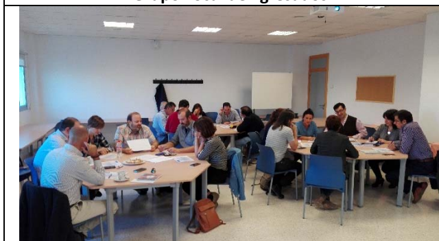
Sesión 2 del Comité del Plan Director