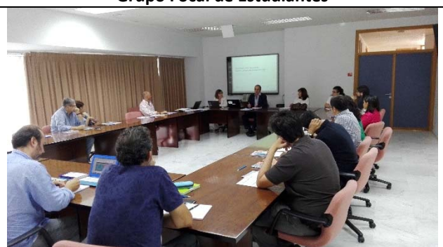
Sesión 1 del Comité del Plan Director