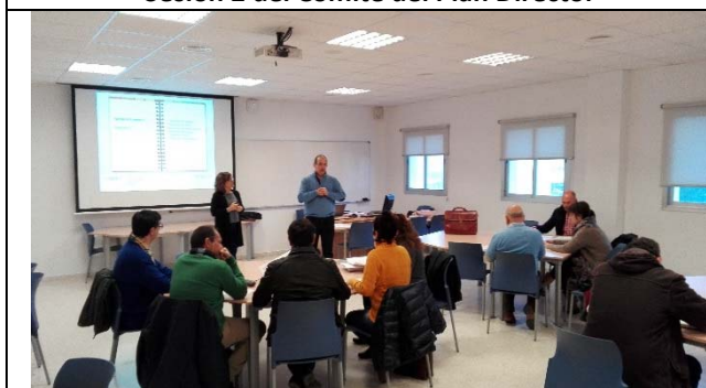
Sesión 5 del Comité del Plan Director