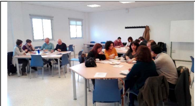
Sesión 7 del Comité del Plan Director