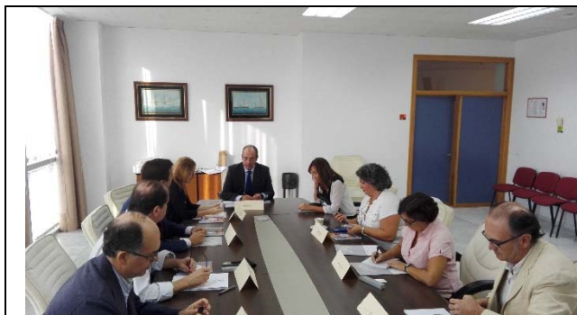
Grupo Focal de Empresas y Sociedad