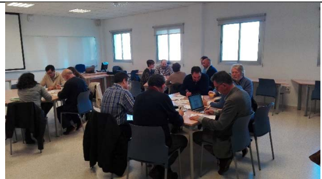
Sesión 8 del Comité del Plan Director